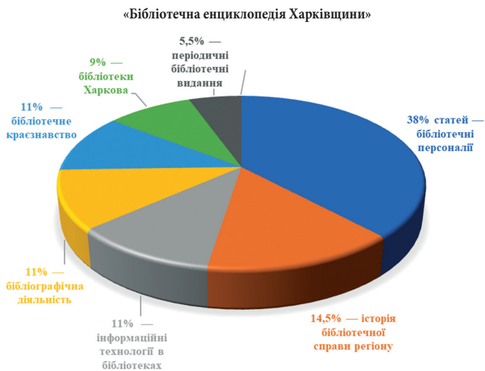
Рис. 1. Особливості тематичної структури контенту БЕХ у 2018 р.

Етап активного наповнення контенту БЕХ припав на 2017–2022 рр. Так, у 2017 р. цифрова платформа Енциклопедії поповнилася 35 статтями, у 2018 р. — ще 20. Тематична структура сформованого ресурсу була такою: 38% статей було присвячено бібліотечним персоналіям, 14,5% — історії бібліотечної справи регіону, 11% — інформаційним технологіям, 11% — бібліографічній діяльності, 11% — бібліотечному краєзнавству, 9% — бібліотекам Харкова, 5,5% — періодичним бібліотечним виданням (Рис. 1).