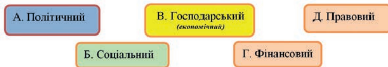
Фіг. 1. П'ять блоків спеціальної (галузевої) документації

Кожен з указаних блоків містить свої підблоки систем документації, які, у свою чергу, є самостійними системами стосовно структурних складових. Під «системою документації» тут значиться комплекс пов'язаних документів, які послідовно віддзеркалюють діяльність певної галузі державного управління, рівень керування, що визначається місцем того чи іншого суб'єкта в системі органів державної влади й управління.