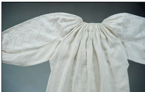
Рис. 4. Вишита жіноча сорочка Полтавщини