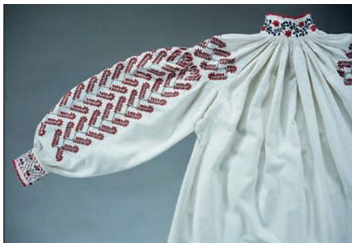
Рис. 5. Вишита жіноча сорочка Київщини