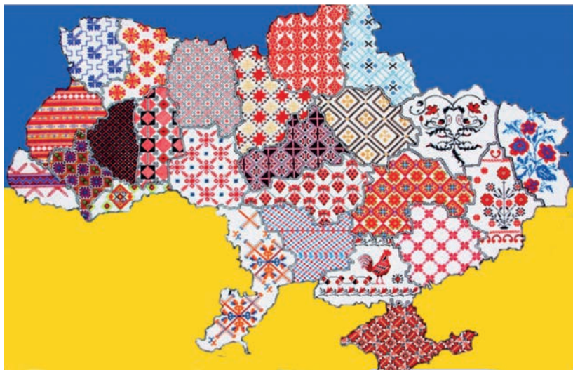
Рис. 1. Вишита Україна (для створення цього зображення було використано зображення з https://undip.org.ua/announce/ukraino-moia-vyshyvana-etnokulturnyy-ta-osvitno-vykhovnyy-potentsial-ukrainskoi-vyshyvanky/ )

З метою визначення особливостей фіксації вишитої інформації на різних видах матеріальних носіїв певними інструментами та засобами, доречним є використання такого визначення: «Вишивка — поширений вид декоративно-прикладного мистецтва, в якому узор та зображення виконуються ручним або машинним способом на різних тканинах, шкірі, повсті та інших матеріалах льняними, бавовняними, шовковими, вовняними нитками, а також бісером, перлами, коштовним камінням, лелітками і т. ін.» (Гасюк & Степан, 1989, с. 33). Дослідники української вишивки виокремлюють понад 100 технік вишивання (Дизайн: словник-довідник, 2010, с. 75–76). У культурологічному контексті феномен української вишивки пов'язують з оберегом, клейнодом, серцем українського народу.