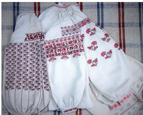
Рис. 6. Вишиті жіночі сорочки Харківщини